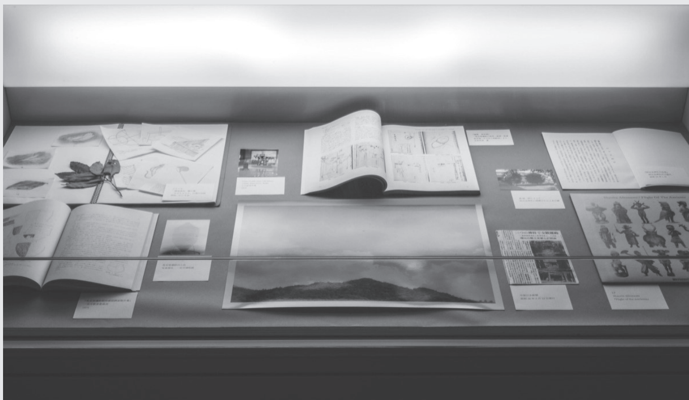
飛行物体 | Flying objects 資料 (2022) / 木村悟之