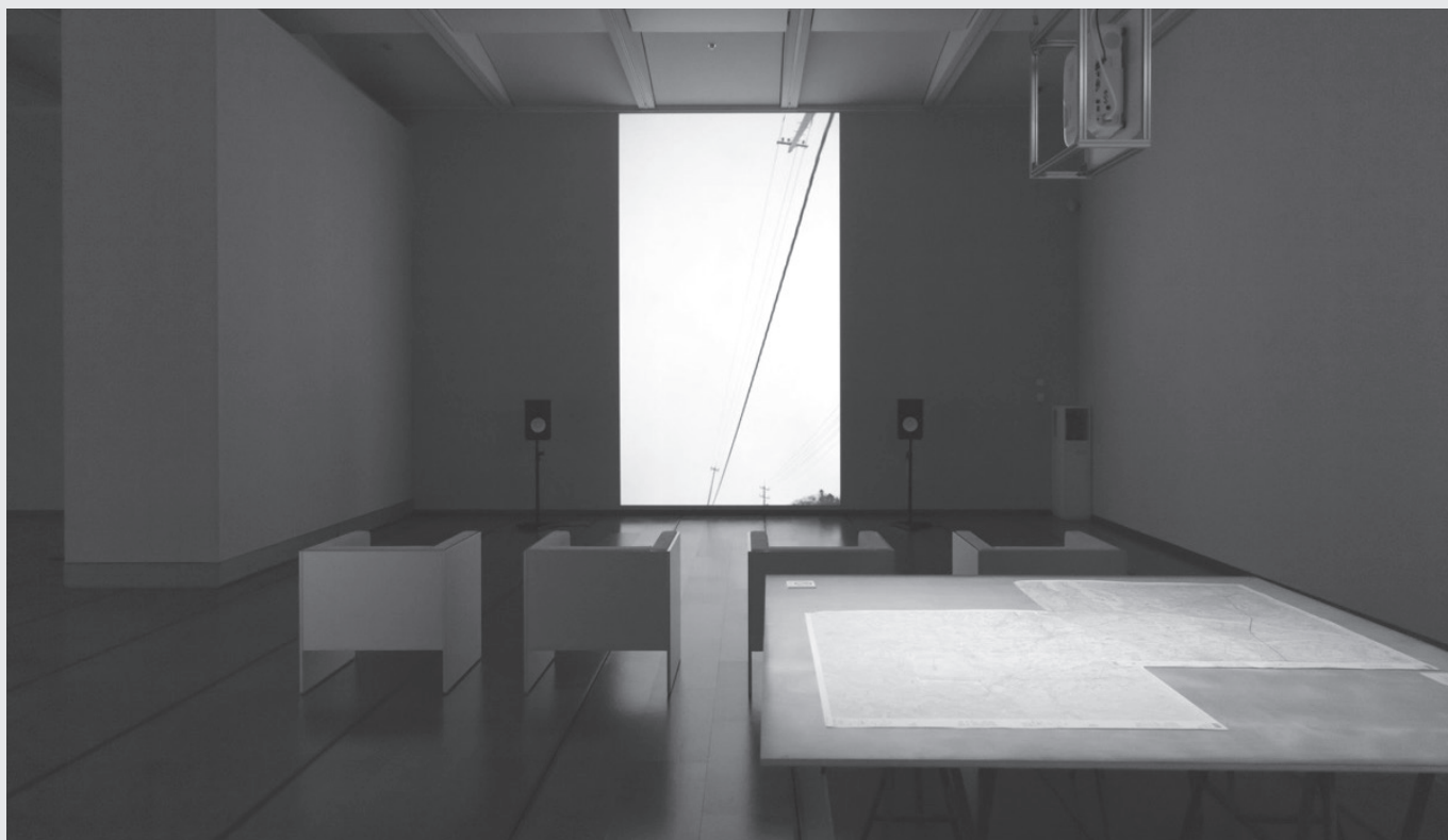
飛行物体 | Flying objects ビデオインスタレーション (2022) / 木村悟之